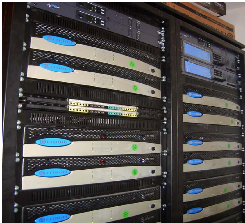
Slika br. 5 – Pojačavači snage i digitalni procesori u ormarima 19"

kontrola pojačavača snage i digitalnih procesora za portalne zvučničke sisteme. Na taj način je preko PC računara u režiji tona omogućeno praćenje svih neophodnih parametara pojačavača snage uz korekciju set-up-a digitalnih zvučničkih procesora zavisno od vrste programa.