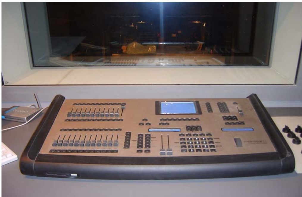
Slika br. 10 – Digitalni mikser u režiji svetla Velike sale