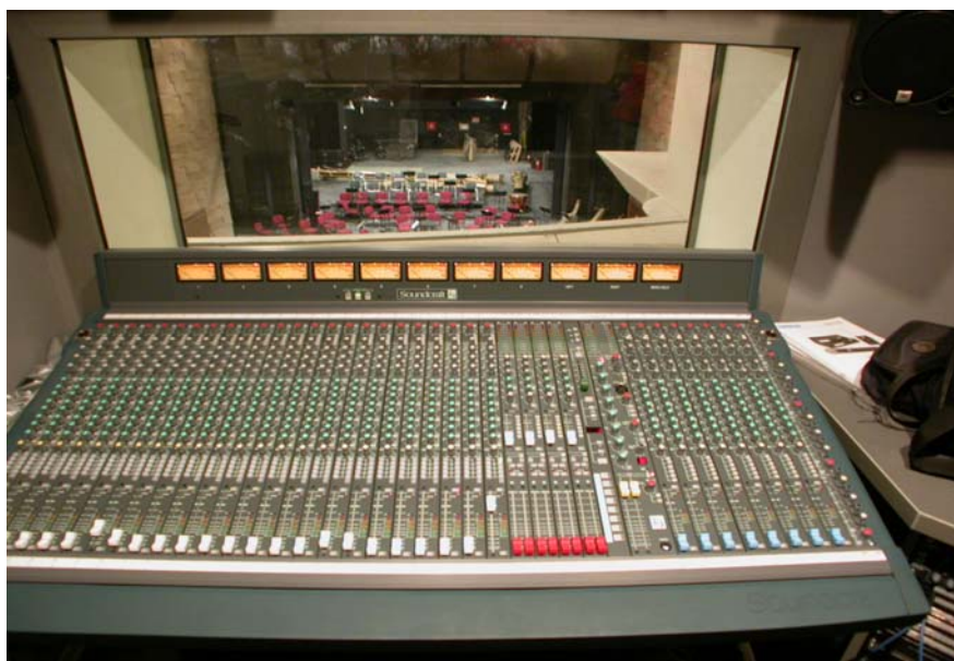
Slika br. 6 – Audio mikser u režiji tona Velike sale

U režiji tona, smeštenoj iznad svečane lože Velike sale, pored 32-kanalnog analognog audio miksera - 24 mic/lin i 8 stereo ulaza (slika br. 6) predviđeno je i više uređaja za snimanje i reprodukciju zvuka u različitim formatima - CD, MD, DAT i PC-WAV, kao i više uređaja za obradu zvuka i efekte (slika br. 7). Za potrebe live performance-a predviđeno je i izdvojeno priključno mesto za prenosni audio mikser u desnoj loži partera, pri čemu se za ovu namenu planira nabavka odgovarajućeg live digitalnog audio miksera.