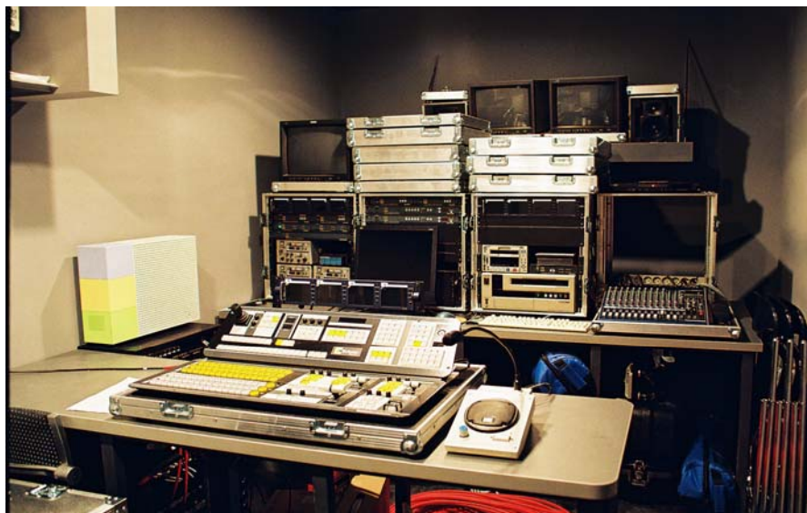
Slika br. 8 – Prenosna oprema u video režiji Velike sale

Sva oprema je smeštena u odgovarajuće prenosne ormare ( flight case-ove ) koji se prvenstveno koriste u video režiji Velike sale (slika br. 8), a po potrebi u sali Studio i drugim prostorima objekta. Od TRIAX priključnih kutija u Velikoj sali, klubu "Belle Etage" i ulaznom holu izvedene su odgovarajuće instalacije za kamere do video režije Velike sale, tako da su obezbeđeni kvalitetni uslovi za potrebe zahtevnih video snimanja uz maksimalnu koordinaciju svih učesnika u tehničkoj realizaciji.