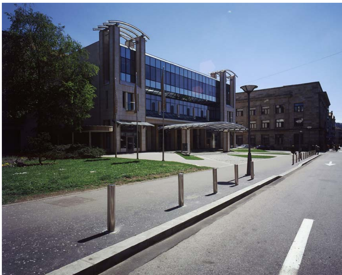
Slika br. 1 – Opera i teatar MADLENIANUM – fasada i glavni ulaz u objekat