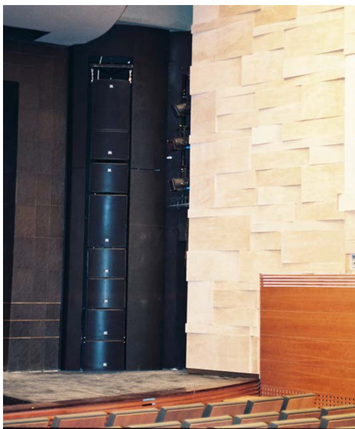
Slika br. 4 – Portalni zvučnički sistem u Velikoj sali

Pošto su pojačavači snage sa pratećom opremom dislocirani u odnosu na režiju tona i nalaze se u tzv. pojačavačkom odeljenju ispod pozornice (slika br. 5), po prvi put je u jednom beogradskom scenskom prostoru, a verovatno i u širem regionu, primenjena računarska