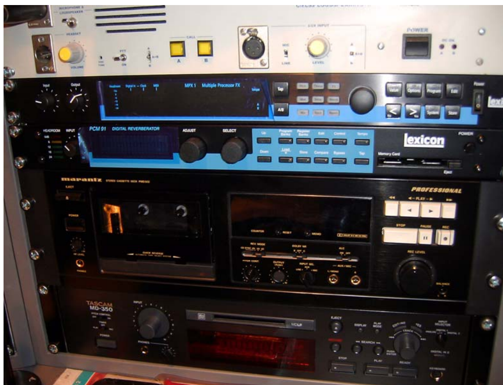
Slika br. 7 – Uređaji za efekte i snimanje zvuka u režiji tona Velike sale

Projektom je obezbeđena i adekvatna međusobna funkcionalna veza sa ostalim bliskim tehnološkim sistemima u ovim prostorima kao što je: sistem za TV snimanja, signalno-komunikacioni sistem, sistem simultanog prevođenja i sl.