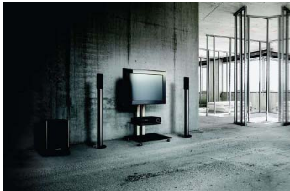
Slika 3 – Početak saradnje pre realizacije enterijera

Potencijalni investitori mahom nisu upoznati sa neophodnoću odgovarajuće tehnološke organizacije i enterijerske obrade prostorija u kojima žele da ugrade vrhunske home theatre sisteme. Praktično, neophodno je da saradnju ostvarimo još u fazi projektovanja enterijera, kada je veoma bitan konsalting u vezi dizajna akustike prostorija predvidjnih za ugradnju home theatre sistema.