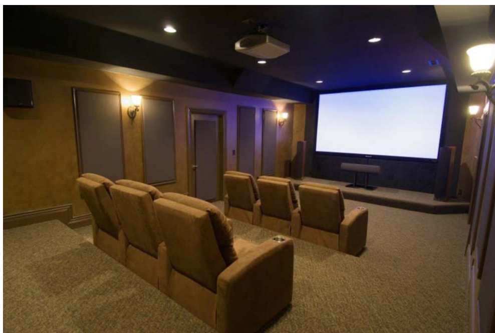
Slika 6 – Finalna ugradnja opreme u realizovanom enterijeru

Na kraju sledi isporuka i montaža opreme na izvedenu instalaciju, pri čemu se prilikom puštanja sistema u rad vrše sva neophodna podešavanja i elektroakustička merenja koja treba da obezbede vrhunske performanse ugrađenog home theatre sistema.