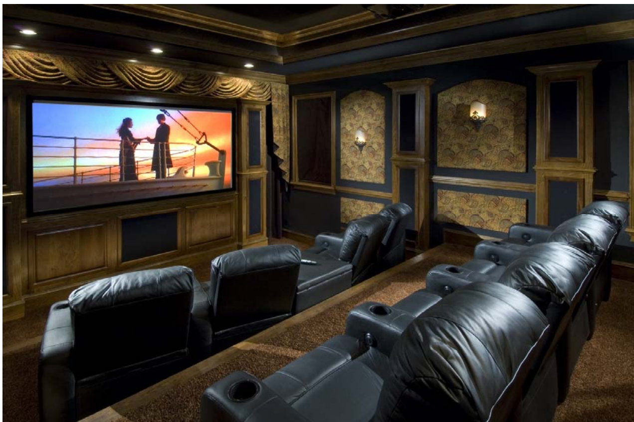
Slika 9 - Primer opremanja namenski projektovanog HOME THEATRE prostora preko 30m 2

Ukupna cena ovog paketa je cca 45.000 EUR, pri čemu finalna cena zavisi od izbora displeja, A/V receiver -a i screen zvučničkih sistema.