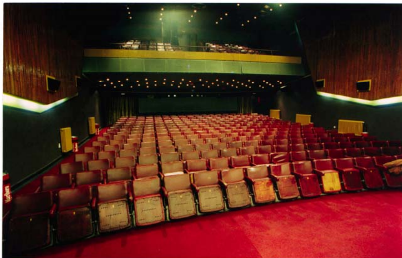
Slika 1 – AKADEMIJA 28 – Prvi DOLBY SR bioskop u Beogradu

AVC PRO je već dve decenije vezan za projektovanje i inženjering audio i video sistema za pozorišta, bioskope i multimedijalne sale. Prvi bioskop u Beogradu smo realizovali još 1996. godine sa originalnim DOLBY SR procesorom u okviru sale AKADEMIJA 28. U pitanju je analogni sistem za višekanalnu reprodukciju zvuka u 5.1 formatu koji pored procesora raspoložuje sa 5 pojačavača snage i odgovarajućim screen , subwoofer i surround zvučničkim sistemima.