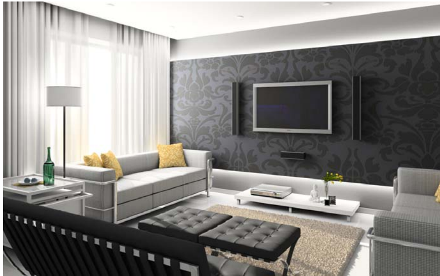
Slika 7 - Primer opremanja HOME THEATRE prostora od 20-25m 2