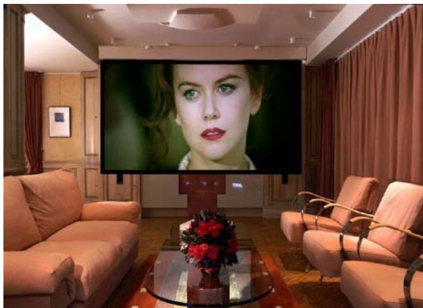
Slika 8 - Primer opremanja HOME THEATRE prostora od 25-30m 2

Ukupna cena ovog paketa je cca 19.000 EUR, pri čemu finalna cena zavisi od izbora displeja, A/V receiver -a i screen zvučničkih sistema.