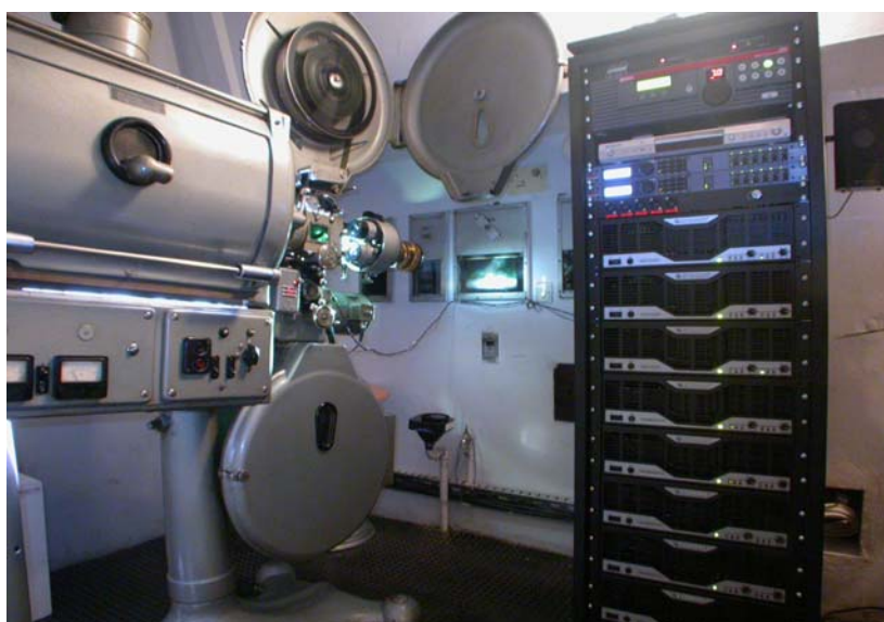
Slika 2 – Kino kabina bioskopa KCB

U međuvremenu je uz saradnju sa nekoliko domaćih firmi realizovano više manjih bioskopskih sala sa DOLBY PRO-LOGIC procesorima ("Scena Masleša", "Roda", "Plava sala" i dr.), a 1999. godine smo učestvovali u projektovanju i realizaciji prvog bioskopa sa digitalnim DTS procesorom u beogradskom bioskopu "Kozara". Početkom 2005. godine AVC je realizovao audio sistem za višekanalnu reprodukciju zvuka u bioskopskoj sali Kulturnog centra Beograda (KCB). U okviru ovog sistema po prvi put u Beogradu je predviđena kompletna THX sertifikovana oprema sa DOLBY Digital filmskim procesorom. Potom su se smenjivali projekti za Veliku salu CENTRA SAVA i bioskopske sale DK OBRENOVAC, DK KLADOVO, DK SOPOT i dr.